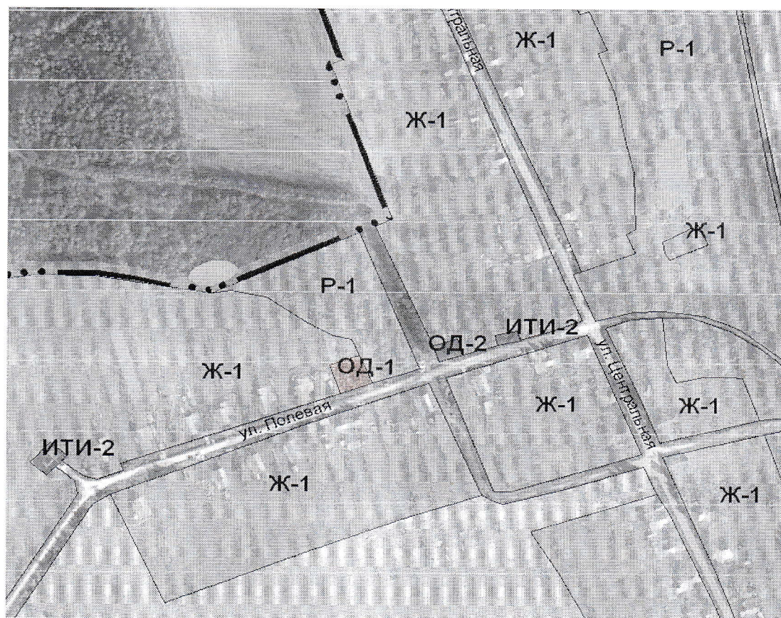
Фрагмент карты градостроительного зонирования д. Брагичи