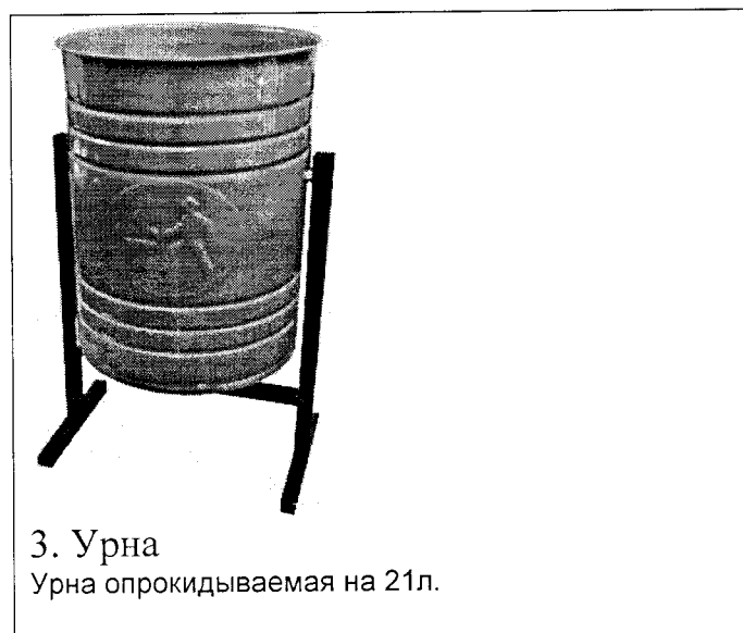
3. Урна Урна опрокидываемая на 21л.