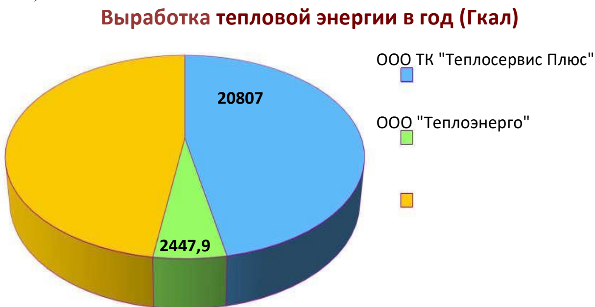
Диаграмма распределения выработки тепла между теплоснабжающими

Распределение выработки тепловой энергии между теплоснабжающими организациями Мирнинского городского поселения представлено на Рисунке 1. Значения выработки тепловой энергии скорректированы с учетом базового года (2018 г.).