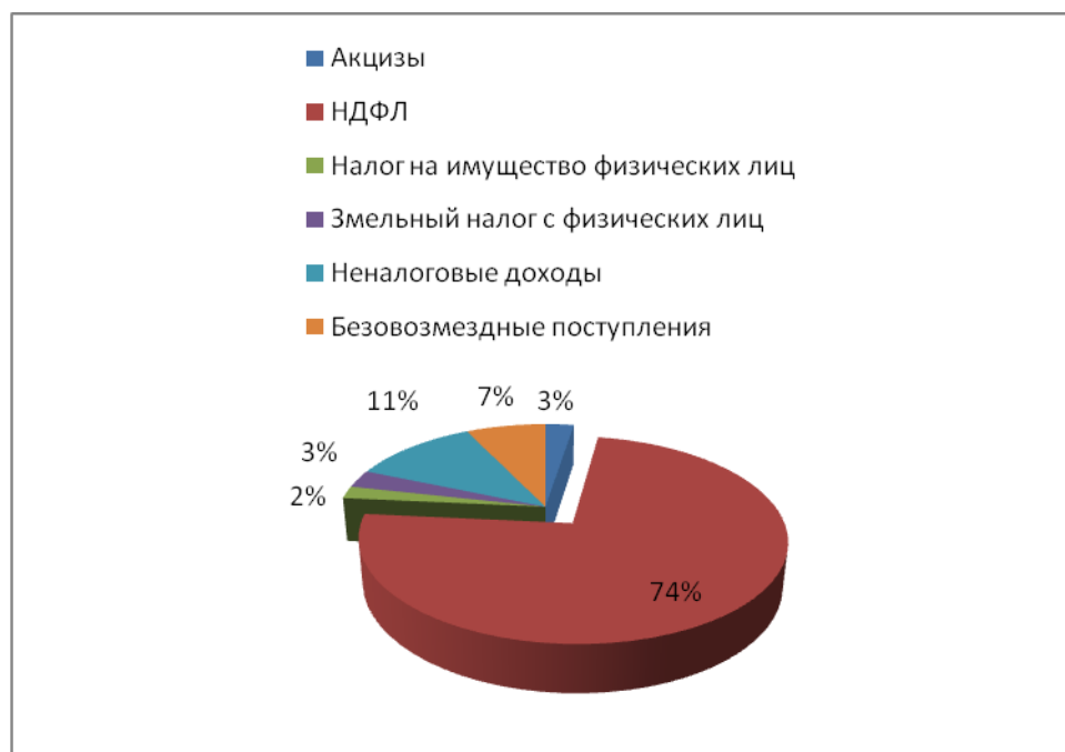
Рис. 1 - Доходы местного бюджета

На рисунке 1 изображена доля собственных налоговых и неналоговых поступлений в бюджете поселения.