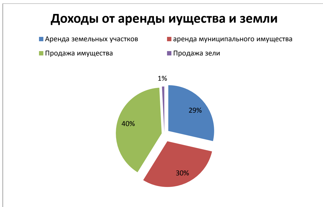
Рис. 3 – Доля, поступивших неналоговых доходов

Доля поступивших неналоговых доходов, полученных при управлении муниципальным имуществом, изображена на рисунке 3.