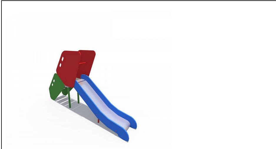
ИО 07180 Горка Н-900 со сплошными бортами (металлический скат)