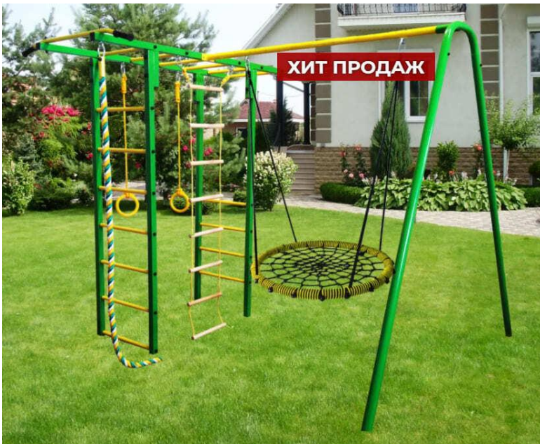
Уличный детский комплекс Топ-8.1 с гнездом