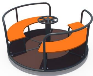
ИО 06100.1 Карусель с рулем Сафари (с двойным сиденьем) Арт. ИО 06100.1 Размер: D-1450, H-690