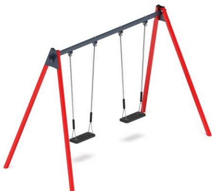
Качели двойные М2 - ИО 12.М.03.03.03-01