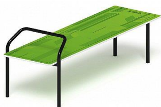
Скамья для прессы (зеленый) - СО 2.40.05-02