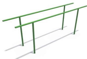
СДО 03080 Брусья