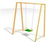
Качели на цепной подвеске ИСУ-07.01 1,6x1,2x2,2