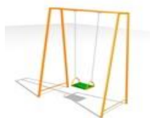
Качели на цепной подвеске ИСУ-07.01 1,6x1,2x2,2