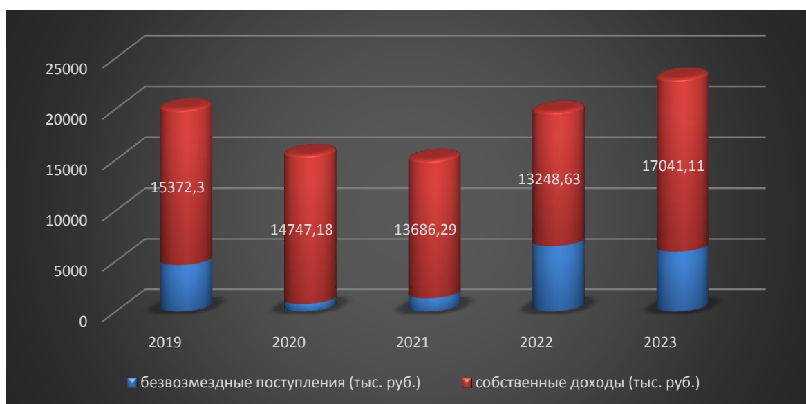
Рис. 1. - Динамика исполнения бюджета

На рисунке 1 изображена динамика исполнения бюджета Мирнинского городского поселения за пятилетний период, с отображением долей собственных доходов и безвозмездных поступлений в бюджете поселения.